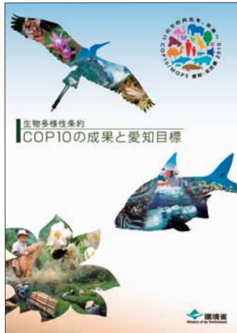
◀ 環境省 普及パンフレット