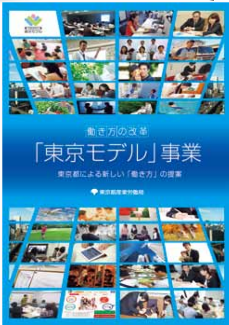
▶「働き方改革」普及冊子